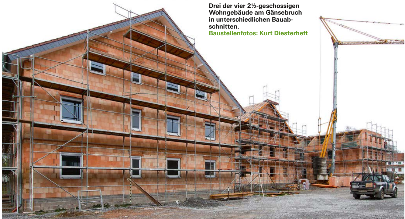
Drei der vier 2½-geschossigen Wohngebäude am Gänsebruch in unterschiedlichen Bauabschnitten.

Bei diesem Bauvorhaben musste der Bauherr nicht erst von den Vorteilen überzeugt werden, da er bereits positive Erfahrungen mit der massiven Ziegelbauweise bei vorherigen Projekten gesammelt hatte. Dennoch sind alle Beteiligten angetan von den optimalen bauphysikalischen Werten des ThermoPlan® MZ10, seiner Robustheit, Langlebigkeit und guten Brandschutzeigenschaften. Für die Planer bedeutet dies: sie können das Dämmniveau maximieren und erhalten genügend Raum für Details und Konstruktion. Sie vermeiden Schädlingsbefall, Feuchtigkeitsprobleme und erhöhen gleichzeitig die Attraktivität der Immobilie. ■