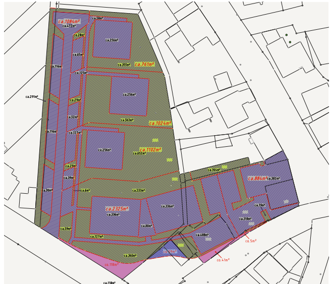
Der Versiegelungsflächenplan zeigt die drei Wohngebäude mit jeweils 6 WE sowie ein Gebäude mit 24 WE.

Für Bauherren und Investoren wird Qualität auch im Geschosswohnungsbau immer wichtiger. Konzepte, die für eine Umsetzung der EnEV auf nachhaltige Lösungen setzen, sind langfristig wirtschaftlicher in Betrieb und Unterhaltung.