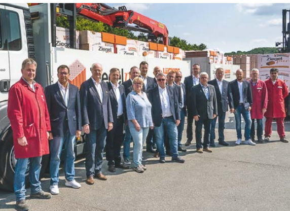
Das Lücking Team