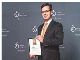
Ziegelplus ausgezeichnet German Design Award WINNER