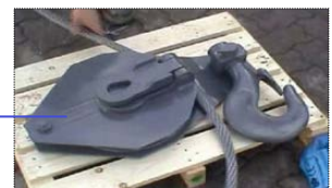
Umlenkrolle (wird an den Mobilkran angehängt)